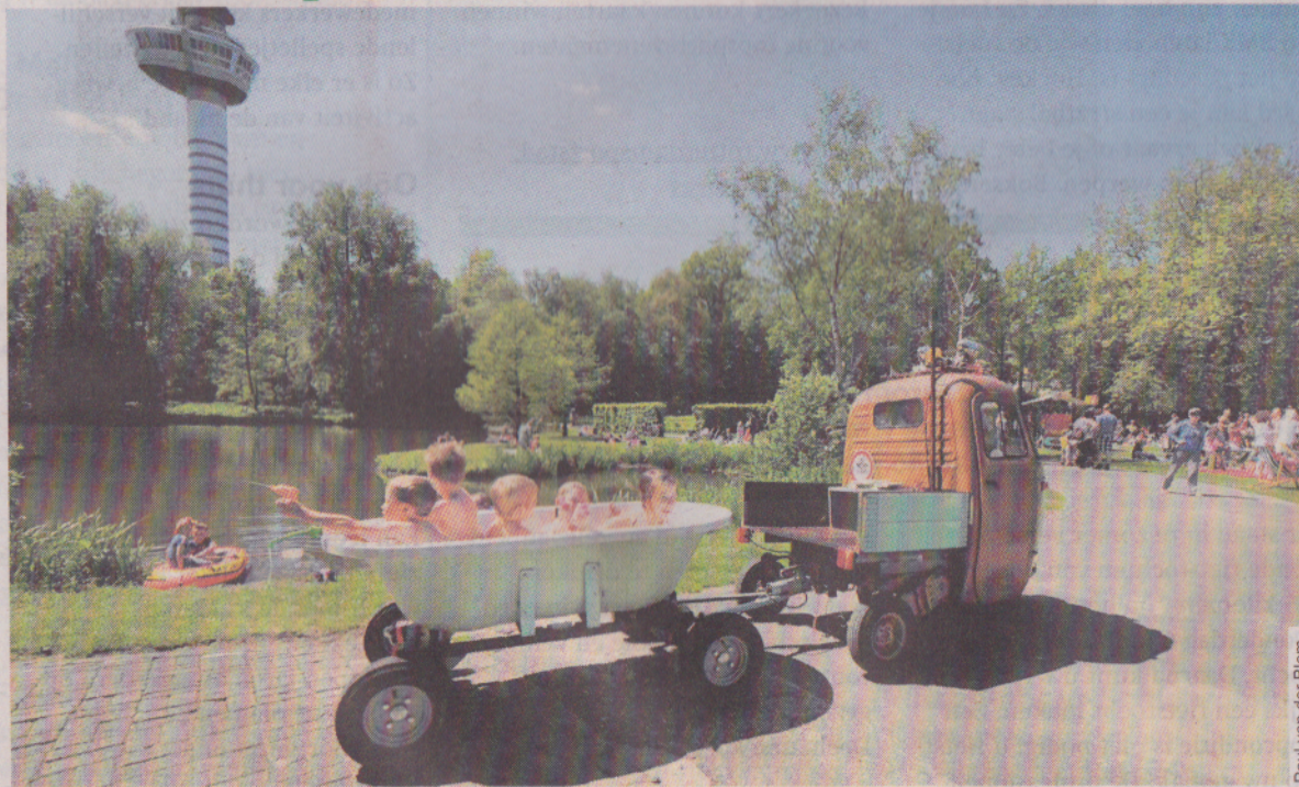
Paul van der Blom

Eindelijk scheen de zon weer eens het afgelopen weekend. En dat kwam goed van pas tijdens de ZomerZondagen in Het Park bij de Euromast. Want om te badderen in 's werelds eerste mobiele Italiaanse badhuis Vespaqua, heb je natuurlijk wel warme zonnestrallen nodig. En die waren er even in overvloed!